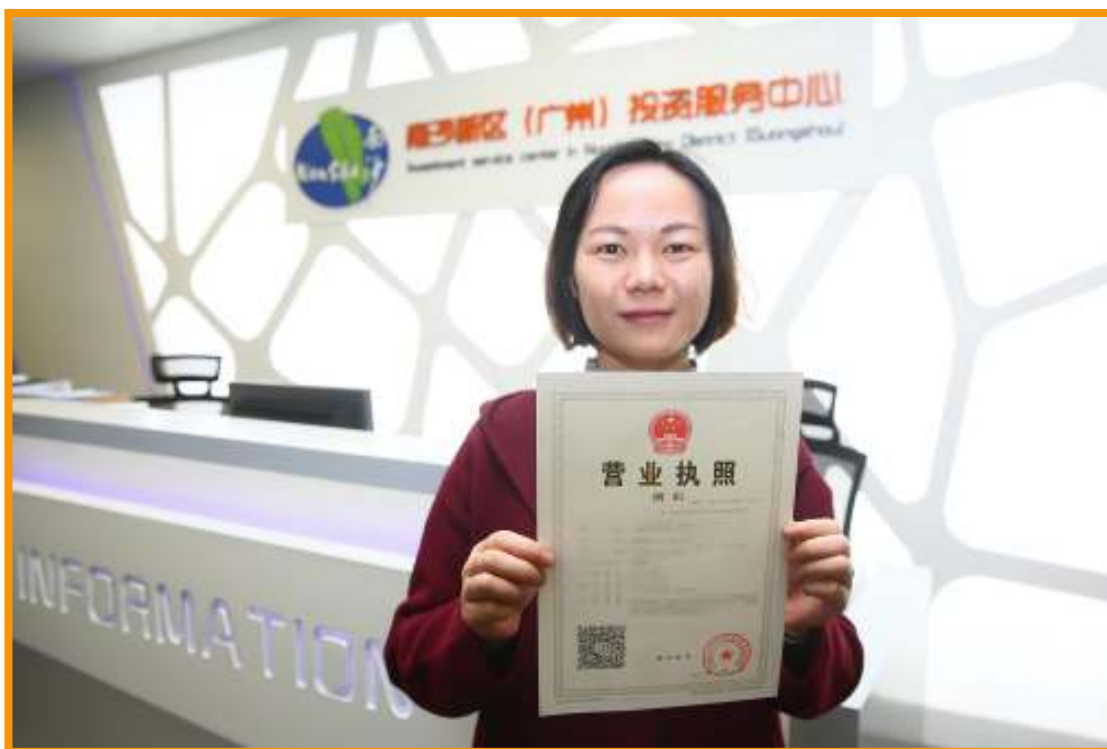
企业代表展示通过“一口受理”窗口办理的营业执照。

服务中心“一口受理”窗口正式开业。除广州银行大厦外，目前九大银行网点、创兴银行香港网点及广东省网上办事大厅均可办理南沙企业注册设立业务。