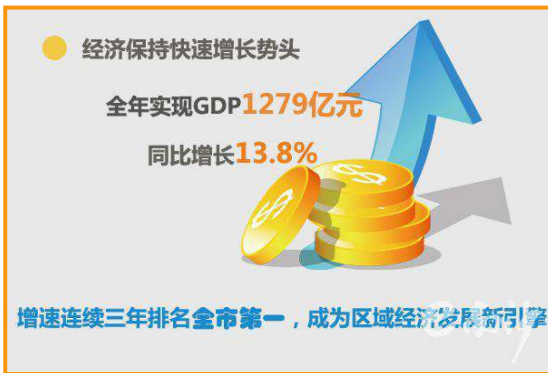
南沙区 2016 年经济发展图示。

全省复制推广。自 2015 年 4 月自贸区挂牌以来，全区新增企业 22949 户，全区企业总数比挂牌前增长两倍多。