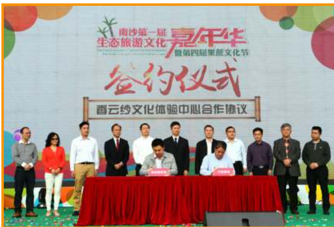
潘玉璋（左六）、邓耀棋（左五）出席签约仪式。

7-8日 “南沙第一届生态旅游文化嘉年华暨第四届果蔗文化节”在南沙榄核镇开幕。榄核镇全镇现有耕地面积6万亩，其中一半种植果蔗，全镇农户以种果蔗为主。年产果蔗23万吨，产值达4亿多元。当天，鑫亚果蔗电商平台同步上线。广州南沙开发区管委会副主任潘玉璋、南沙区副区长邓耀棋、羊城晚报报业集团总经理李和平、羊城晚报社副社长李宜航、星海音乐学院党委副书记李振连等出席相关活动。