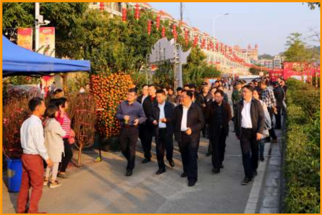
丁红都(右三)、徐永(右四)、董可(右二)到南沙街花市开展春节前公共安全大检查。

25日 市委常委、区委书记丁红都带队开展春节前公共安全大检查，走访南沙花市，检查花市公共安全情况并慰问花市工作人员。区领导徐永、董可、朱承志、翁殊武、李刚等陪同检查。