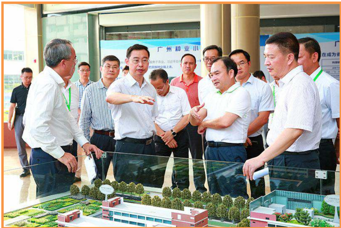
温国辉（前排左二）到南沙区调研农业发展工作，蔡朝林（前排左一），曾进泽（前排左四）陪同。

15日 广州市市长温国辉到南沙区调研农业发展工作。温国辉察看和了解广州种业小镇地标广场、广州冠胜国际种业交易中心的规划建设情况，并到东涌镇大稳村，察看卫生服务站、生态农业示范点、水上绿道及周边人居环境整治等情况。广州市委常委、区委书记蔡朝林，区委副书记、区长曾进泽等陪同调研。