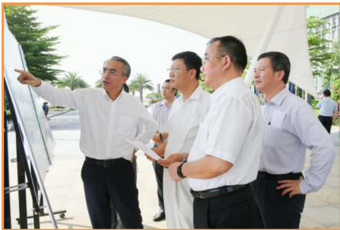
蔡朝林（左一）为陈建华（左三）介绍明珠湾过江通道桥隧开发建设情况，曾进泽（左五）等陪同。

12日 广州市人大常委会主任陈建华到南沙区调研。广州市委常委、区委书记蔡朝林，开发区（区）领导曾进泽、史勇、周波等陪同调研。