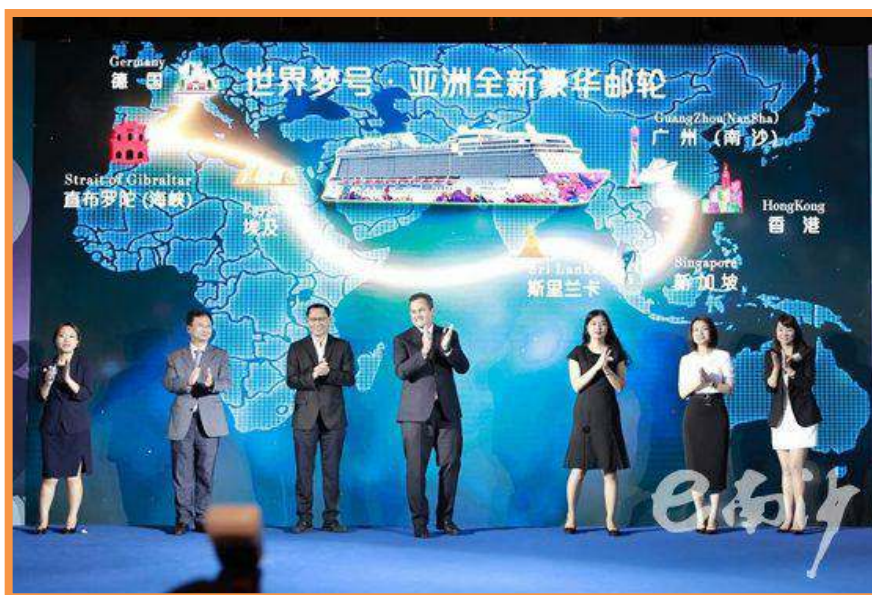
“邮历更大的世界”新闻发布会现场。

1月1日至8月31日，「云顶梦号」在南沙邮轮码头累计运营60个艘次，总计超过21万人次旅客吞吐量。