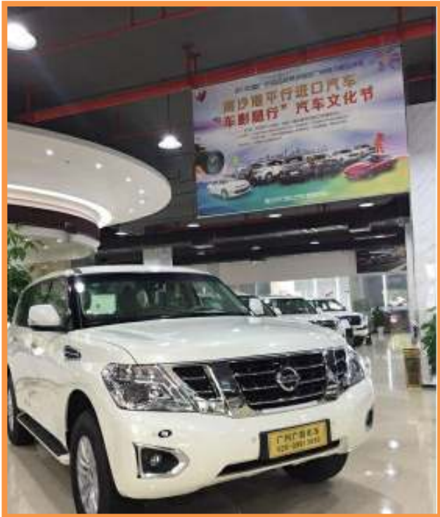
南沙区平行进口汽车“车影随行”文化节。

1日 由广东省汽车电子商务促进会南沙平行进口分会主办，广州港南沙汽车码头承办的“车影随行”文化节开幕。南沙平行进口汽车展览中心自2017年4月启用以来，平行汽车销售量增加5倍，居华南平行进口车产业链前列。2017年1至8月份南沙汽车口岸实现平行进口汽车到港8388台，超过2016年全年平行进口汽车业务总量。