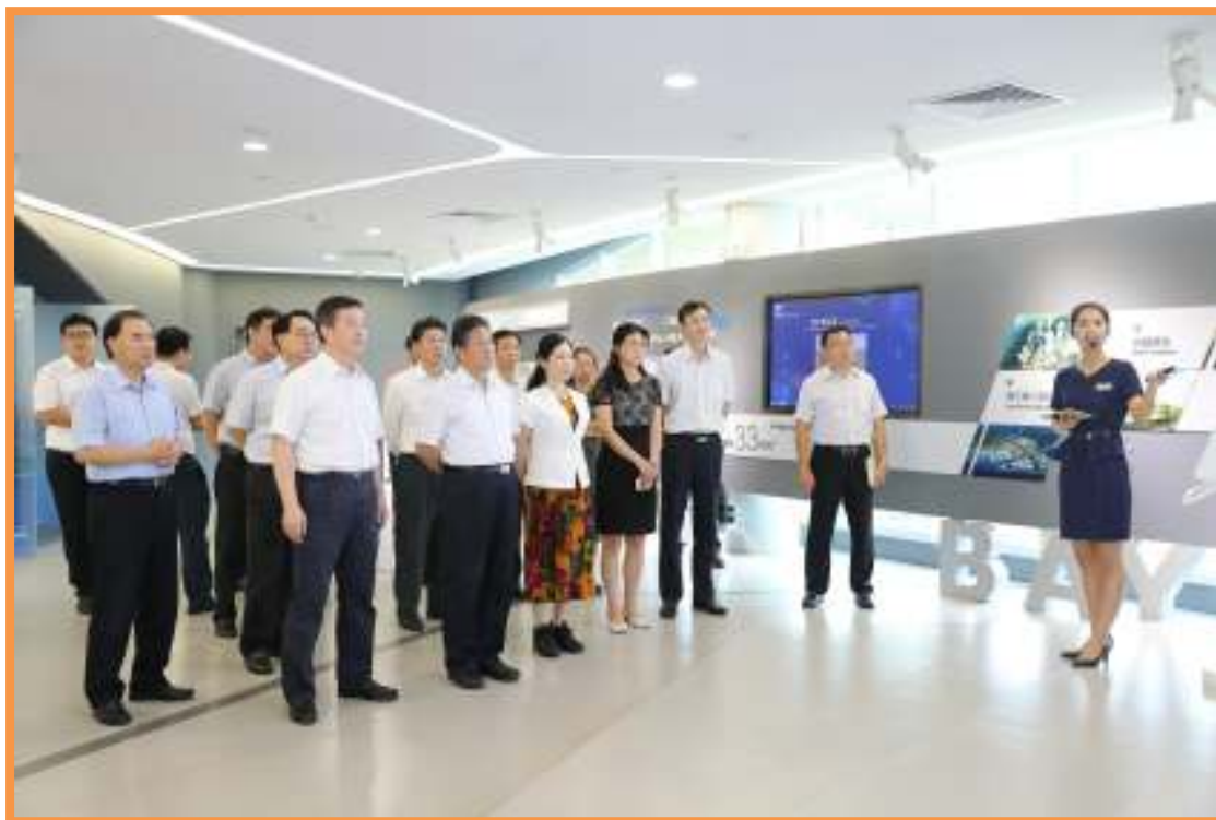
刘长喜到南沙区明珠湾展示馆参观。

4日 天津市政协副主席刘长喜率队到南沙区考察，区委副书记、区长曾进泽，区政协主席钟华英、副主席余若兰陪同考察。