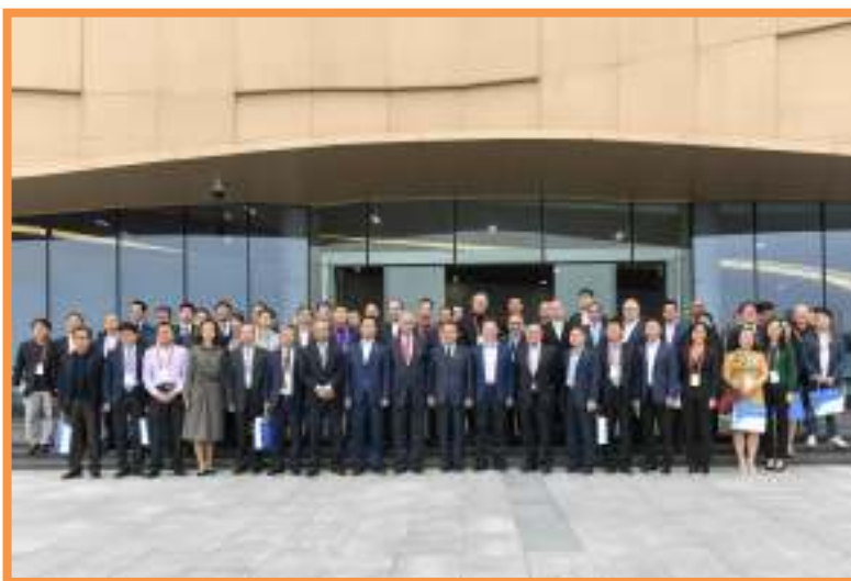
参观考察明珠湾区展览中心后合影。

20 日 参加国际金融论坛（IFF）第 14 届年会的韩国前总理韩升洙，巴基斯坦前总理阿齐兹一行到南沙参观考察明珠湾区展览中心、南沙湿地公园，了解南沙自贸区块规划情况。南沙区区长曾进泽，开发区（区）领导王大通、邢桦、阮晓红等陪同。