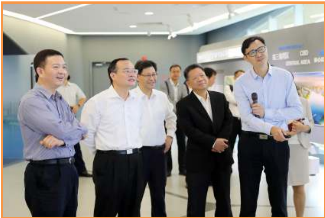
袁宝成（左二）到南沙明珠湾开发展览中心考察。

15日 广东省副省长袁宝成到广东自贸区南沙片区调研商事制度改革、证照分离改革情况，广州市副市长叶牛平，南沙区长曾进泽陪同。