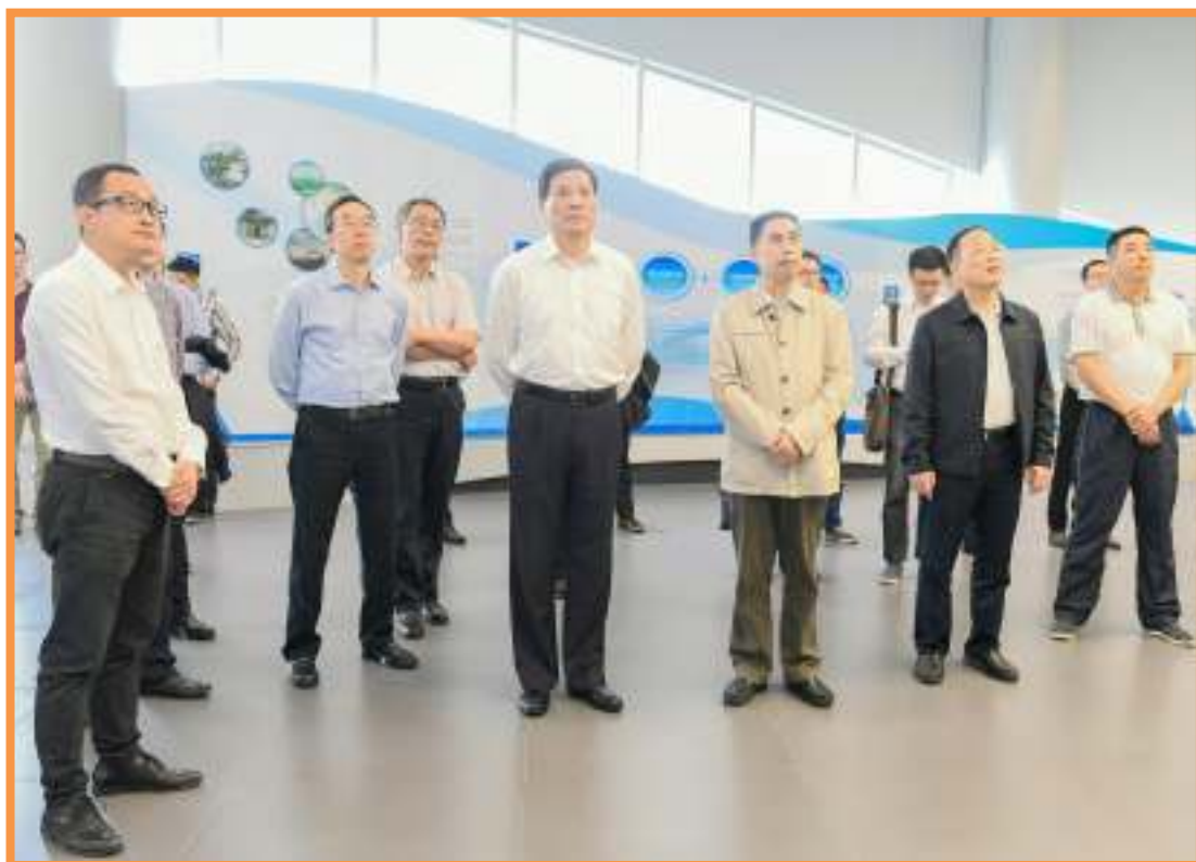
夏耕（前排右四）到南沙明珠湾区开展览中心考察。

9日 山东省人大常委会副主任夏耕率到南沙参观考察，南沙区领导曾进泽、张谭均、王军等陪同。