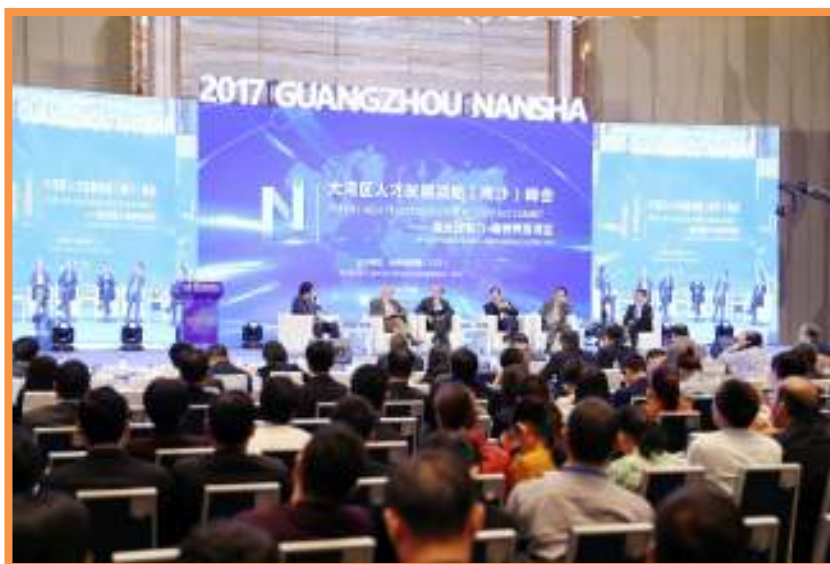
广州南沙人才工作大会暨大湾区人才发展战略（南沙）峰会现场。

专家、澳门大学学术副校长倪明选，中国人事科学院原院长、中央人才协调小组特聘专家吴江，香港科技大学人文与社会科学学院副院长崔大伟（David Zweig）等出席活动。会上，南沙区为 2 支重点项目团队和 9 名高端领军人才颁发奖励和荣誉证书。广州理文科技有限公司院士陈新滋新型有机氟功能材料研发和产业化团队获得最高奖励支持 2800 万元；中科院先进技术研究所院士韩彰秀串并联高柔性混合与多维工业机器人产业化团队获得奖励支持 700 万元。广州市委常委、南沙开发区（自贸区南沙片区）党工委书记、管委会主任、南沙区委书记蔡朝林出席活动并讲话。目前，南沙区已布局人才社区 4 个，推出人才公寓 3000 多套。集聚诺贝尔奖获奖者 1 名、院士 10 名、国家“千人计划”专家 15 名、广东省“珠江人才计划”创新创业领军团队 2 个、广州市高层次人才 30 余人。已认定南沙区高端领军人才 9 名；发放购房补贴 970 万元；南沙区重点发展领域急需人才 2300 余名，5300 余人次；发放特殊人才奖励金约 2 亿元。