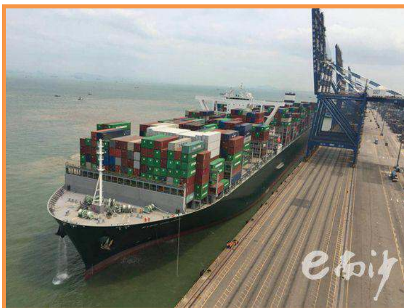
全球最大集装箱船靠泊南沙港。

14日 全球最大型集装箱船 20244TEU 长富轮 (ULCS EVER GOLDEN) 成功挂靠南沙海港码头，是继“美迪·马士基” 3E 级 18000TEU 船和“中海环球” 19000TEU 级船之后，南沙海港码头再次刷新全球最大集装箱船靠泊作业记录。长富轮船长 400 米，型宽 58.8 米，可载箱 20244TEU，夏季吃水 16.025 米，是全球最大集装箱船之一，于 3 月 30 日交付。